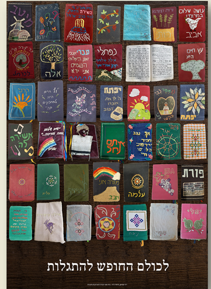
לכולם החופש להתגלות