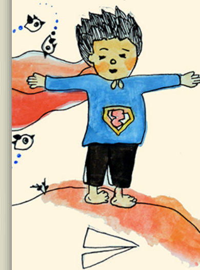
ספר, ח. פורש כתיב - בין האני לאחר