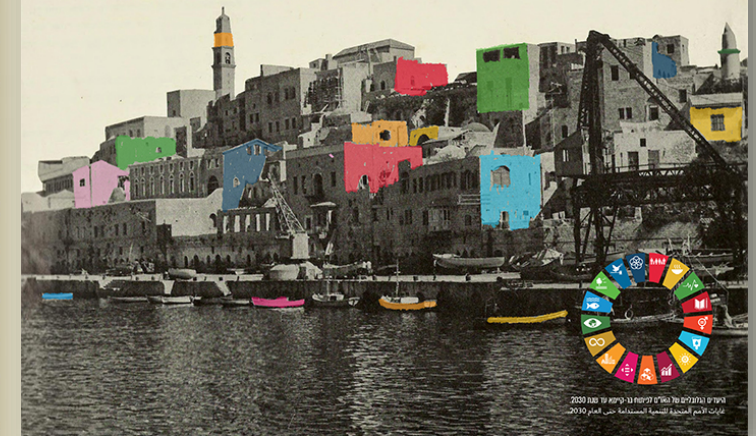
תמונה: הרחבת היקף של מושגי היסוד לתיאור כל היעדים עד שנת 2030 לדרכי המוסדות השלטוניים

תחבנות אל העבר - בנות את העתיד הגדרה חודשת של מושגי היסוד להשפעת יעדים חברתיים