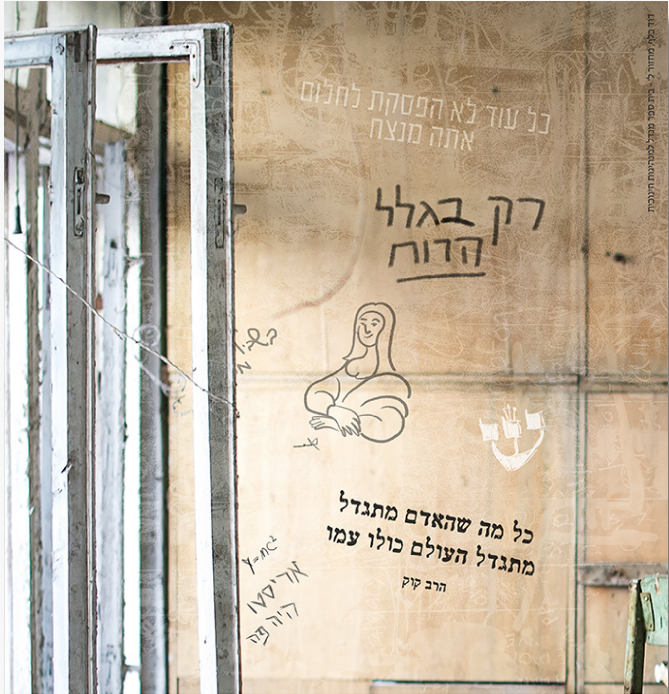
במקום שאין, הנה רוח בחצר האחורית