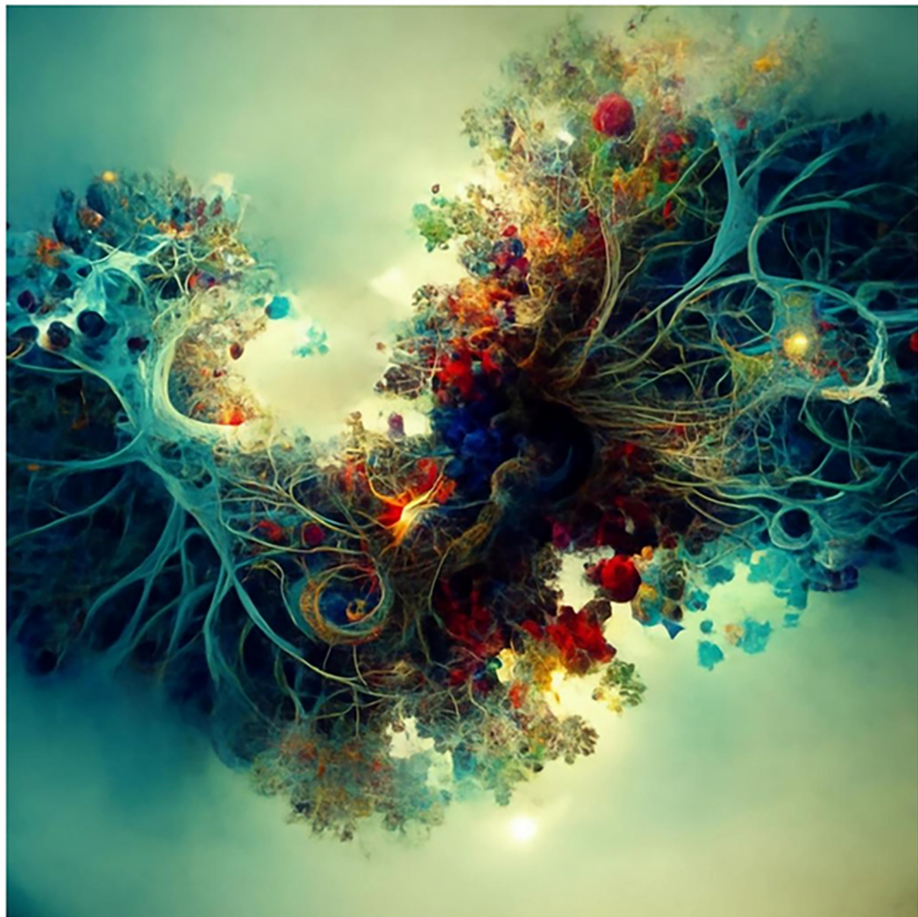
מודל ללמידה פתוחה במערכות אורגניות